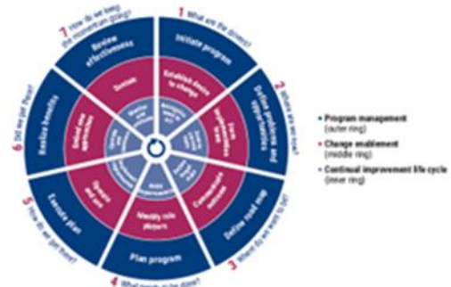
Gambar 1. Roadmap COBIT 2019 ISACA 2019

Pelaksanaan Penelitian didasarkan pada roadmap yang terdapat pada kerangka COBIT 2019 yang di tunjukkan pada gambar 1