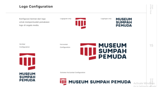
Gambar 1. Konfigurasi LogoMark dan Logotype yang terdapat dalam Graphic Standard Manual Logo Baru Museum Sumpah Pemuda

Merupakan logo visual berbentuk susunan huruf yang dapat memberikan pesan secara tertulis kepada audience . Logotype juga bertujuan untuk penunjang kepada Picture Mark agar visual dari Picture Mark dapat teridentifikasi secara baik dan tepat.