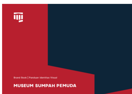
Gambar 9 Halaman depan dari Graphic Manual Book Logo baru Museum Sumpah Pemuda.

media komunikasi yang dibutuhkan. Penggunaan Graphic Standard Manual ini dibuat agar penempatan logo sebagai identity suatu perusahaan dapat tersusun secara sistematis, sehingga tidak terjadi salah persepsi dalam pandangan penerapan logo disetiap media yang digunakan itu harus dipegang oleh objek atau Museum Sumpah Pemuda.