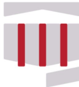
Gambar 5 (Warna Merah) Visual logo dari Tiga Pilar.

Monumen tiga pilar yang mewakili tiga Sumpah Pemuda bermakna sebagai tonggak penyangga kekokohan Pemuda Indonesia.