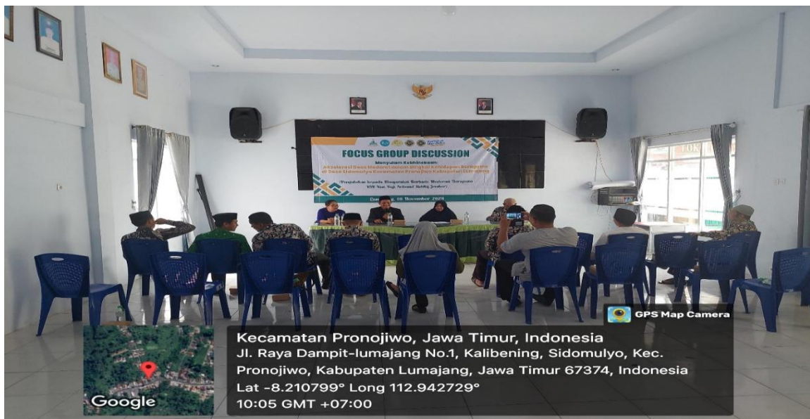
Gambar 1.3 FGD Akselerasi Desa Moderat dalam Bingkai Kehidupan Beragama di Desa Sidomulyo Kecamatan Pronojiwo Kabupaten Lumajang

Adapun hasil rumusan impian atau tujuan yang muncul dari proses Focus Group Discussion (FGD) bersama komunitas adalah dua hal utama. Pertama, keinginan untuk meningkatkan kualitas sumber daya manusia (SDM) dalam hal pengetahuan dan pemahaman mengenai moderasi beragama. Kedua, pengembangan kapasitas kreatif dalam mengelola dan memberdayakan aset budaya serta keagamaan yang ada di desa. Kedua harapan ini dipandang sebagai fondasi penting bagi pencapaian cita-cita menjadikan Desa Sidomulyo sebagai model desa moderat yang dapat menyulam kebhinekaan di tengah pluralitas keyakinan.