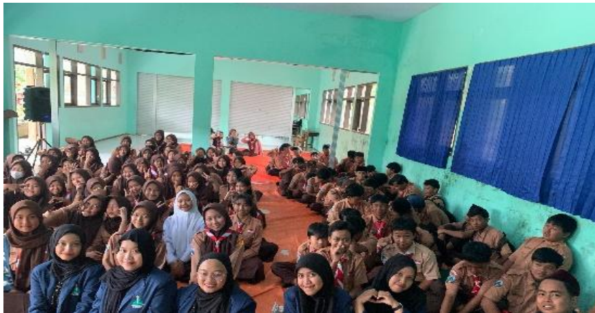
Gambar 1.4 Penyuluhan Moderasi Beragama

Selanjutnya, pada 22 November 2024, dilaksanakan FGD dengan melibatkan tokoh lintas agama di Desa Sidomulyo. Diskusi ini menjadi wadah bertukar pandangan sekaligus menguatkan komitmen kolektif terhadap nilai-nilai toleransi. Adapun kegiatan terakhir dalam tahapan design yaitu forum perencanaan pengembangan aset, dilaksanakan pada 27 November 2024. Forum ini membahas langkah-langkah konkrit yang akan ditempuh dalam memberdayakan potensi lokal agar lebih optimal dan berkelanjutan. Dalam proses perencanaan, pembagian peran dan tanggung jawab ditentukan secara kolaboratif. SDM lokal bertindak sebagai pelaksana utama, sementara tim PkM mengambil peran sebagai fasilitator dan pendamping. Model ini diterapkan agar tercipta rasa kepemilikan yang kuat dari warga terhadap program yang dijalankan.