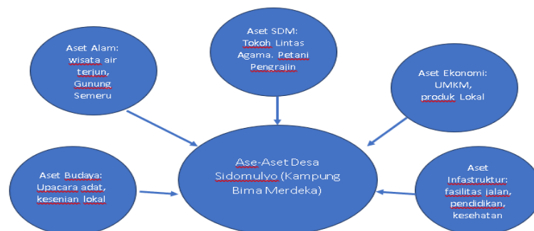
Gambar 1.3 Community Mapping Kampung Bima Merdeka

Selanjutnya dilakukan community mapping atau pemetaan komunitas, yang mencakup identifikasi struktur sosial dan kelembagaan desa. Hasil pemetaan menunjukkan bahwa Kampung Bima Merdeka telah memiliki struktur organisasi yang lengkap, namun belum menetapkan arah program kerja secara sistematis.