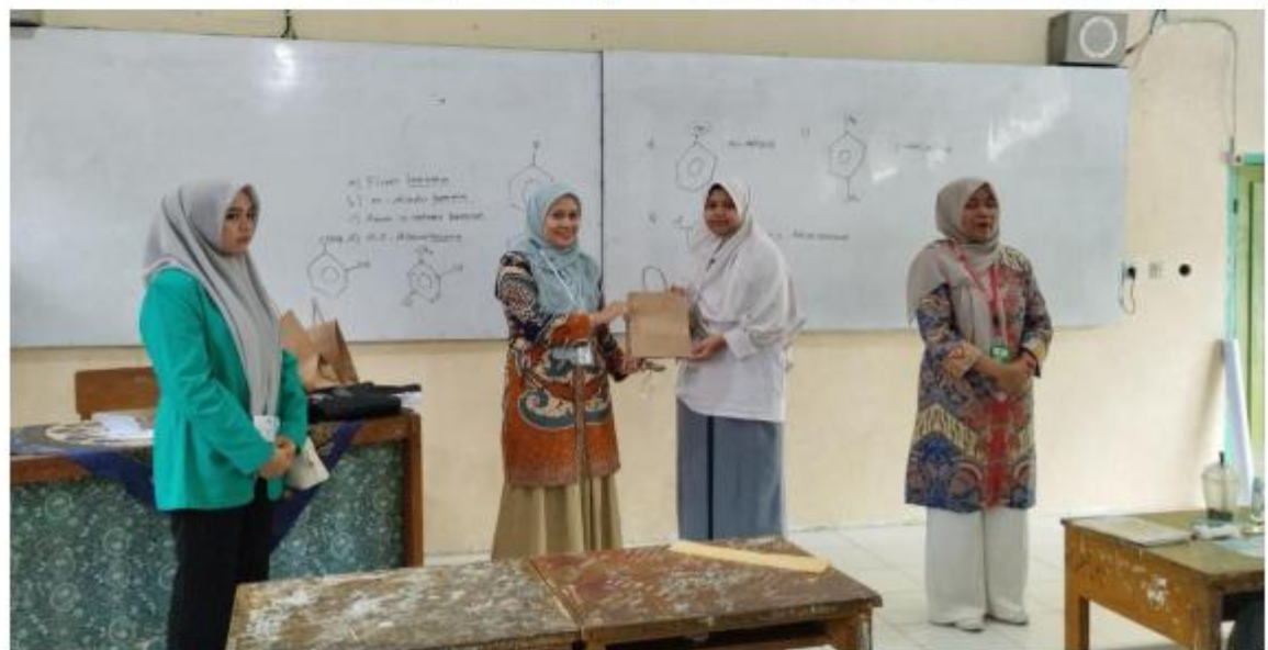
Gambar 4.2. Penyampaian Materi Literasi Keuangan Syariah di di MAN 2 Padang