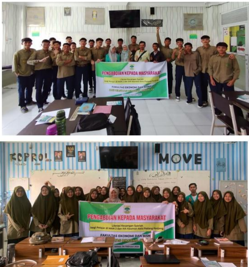
Gambar 4.3. Foto Bersama para siswa

Berdasarkan hasil diskusi bersama para siswa siswi maka Literasi Keuangan Syariah bagi siswa siswi tersebut masih kurang sehingga di perlukan pengenalan secara langsung Lembaga keuangan dan non-keuangan Syariah yang ada di Indonesia serta operasionalnya dan berbagai istilah terkait keuangan syariah. Oleh karena itu, Pemberian materi terkait Literasi Keuangan Syariah harus terus dilakukan sebagai salah satu upaya untuk memperkenalkan keuangan Syariah, operasional perbankan syariah dan Lembaga keuangan non bank. Selain itu, diperlukan pendampingan dan juga pelatihan Literasi keuangan syariah agar pengenalan keuangan syariah dan teknis operasionalnya agar dapat dipahami secara teknis dan diaplikasikan oleh siswa siswi pada MA Kauman Muhammadiyah dan MAN 2 Kota Padang Panjang, Provinsi Sumatra Barat.