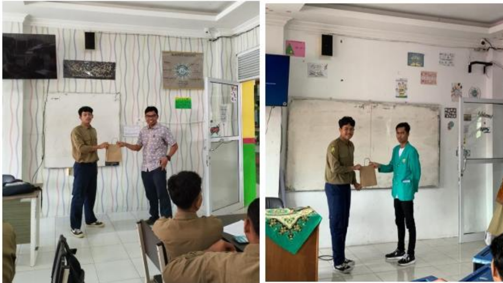
Gambar 4.3. Penyampaian materi Literasi Keuangan Syariah di MA Kauman Muhammadiyah

Berdasarkan hasil angket yang dijawab oleh para siswa, pengetahuan siswa mengenai literasi keuangan syariah berada pada kategori sedang. Pemahaman mengenai dasar hukum keuangan syariah dan fiqh mamalah di kalangan siswa cukup baik, hal ini dilatarbelakangi karena ada mata pelajaran yang mendukung pemahaman mengenai keuangan syariah di pondok Pesantren. Setelah penyampaian materi, siswa/i juga diberikan beberapa pertanyaan yang berkaitan tentang keuangan syariah. Siswa dan siswa yang berhasil menjawab pertanyaan dengan benar diberikan hadiah yang telah disiapkan oleh Tim Pengabdian.