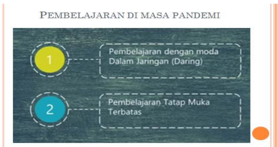
Gambar 3: Tampilan Pembelajaran di Masa Pandemi