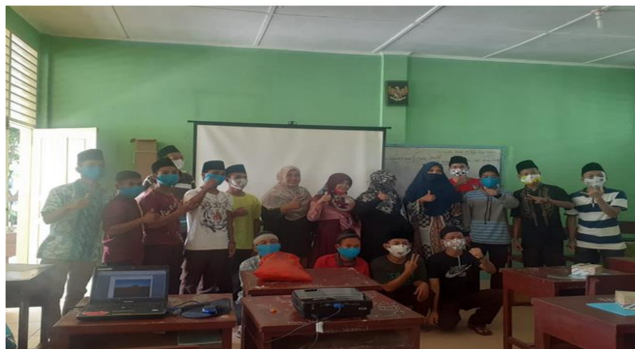
Gambar 6. Kegiatan Foto Bersama Siswa-siswa Panti Asuhan