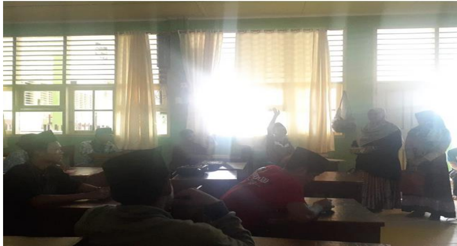
Gambar 4. Kegiatan Dalam Pelatihan PKM