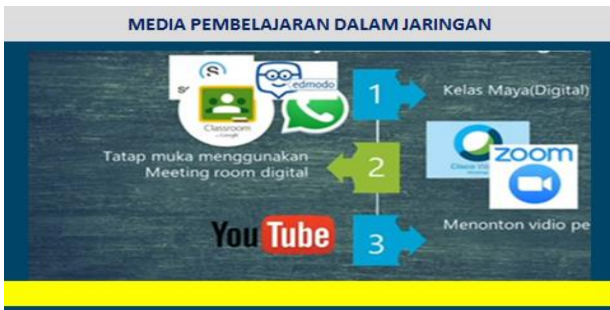
Gambar 1: Tampilan Media Pembelajaran Dalam Jaringan

Pelaksanaan kegiatan pelatihan dilakukan secara tatap muka di ruang kelas SMA Tri Guna Padang yang lokasinya berada di lingkungan Panti Asuhan Putra tersebut. Pelatihan ini dibagi atas 2 sesi, yaitu sesi pertama dimulai dengan penjelasan tentang bagaimana memanfaatkan internet secara efektif dalam pembelajaran daring. Dalam hal ini tim PKM menjelaskan media apa saja yang bisa digunakan dalam jaringan untuk proses pembelajaran secara online dan 5 cara yang digunakan untuk memanfaatkan internet secara efektif sebagai media pembelajaran. Sesi kedua adalah mengadakan tanya jawab serta kuis bagi siswa yang telah paham dengan materi tersebut. Materi ini disampaikan secara bergantian oleh tim PKM. Diharapkan materi yang telah disampaikan ini dapat dipraktikkan oleh siswa-siswa Panti Asuhan dan diterapkan pada saat proses pembelajaran di kelas. Beberapa materi yang masih belum dapat dipahami pada saat pelatihan dapat diulang dan dipraktikkan kembali oleh para siswa dilain waktu dengan acuan modul yang diberikan oleh tim PKM. Bentuk materi dari pelatihan ini dapat dilihat pada Gambar 1 sampai Gambar 3.