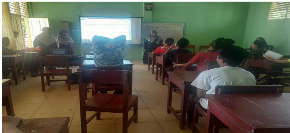
Gambar 5. Kegiatan Diskusi dan Tanya Jawab PKM