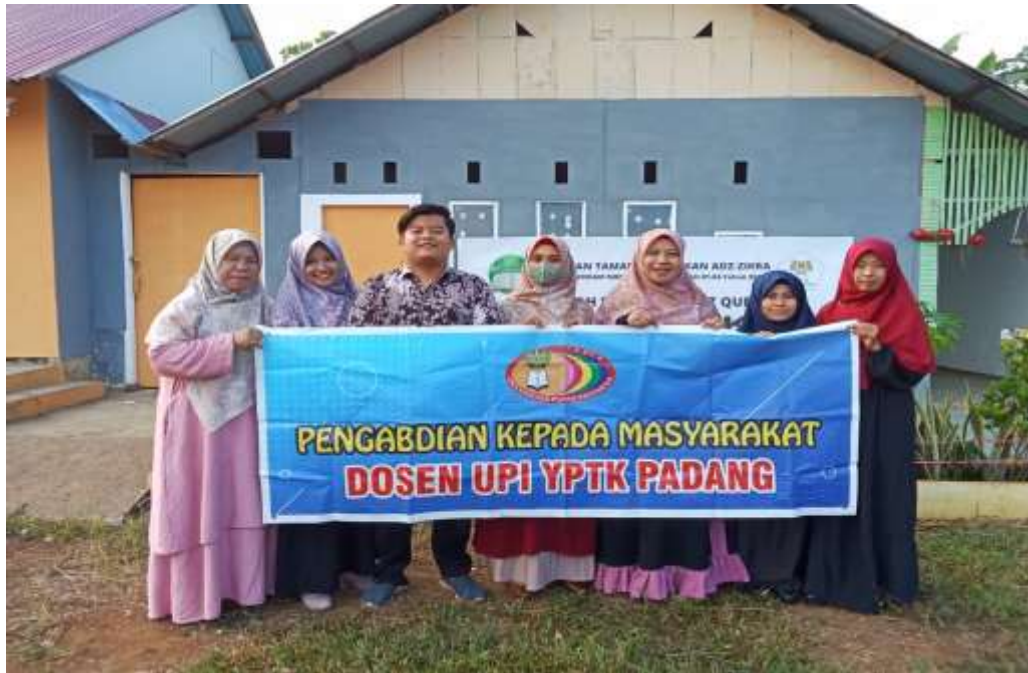
Gambar 4. Foto Bersama Guru

Dalam pemanfaatan internet dalam proses pembelajaran ini digunakan terlebihnya melakukan konsultasi dengan guru apa yang mereka butuhkan untuk dipelajari baik dalam membuat bahan ajar maupun trik dalam pembelajaran menggunakan media di internet 11 . Kegiatan pengabdian ini memberikan hasil yang cukup signifikan yang ditandai dengan semangatnya guru-guru dalam melakukan praktek untuk membuat bahan ajar. Hal ini dapat dilihat dari sudah tercapainya tujuan PKM ini bahwa guru-guru bisa dan mampu menggunakan internet dalam membuat bahan ajar karena sebelumnya internet juga ukan hal yang baru untuk guru-guru, karena kebanyakan guru sudah menggunakan hp android 12 . Ketercapaian hasil yang diharapkan pada kegiatan pengabdian didukung oleh beberapa faktor sebagai berikut 13 :