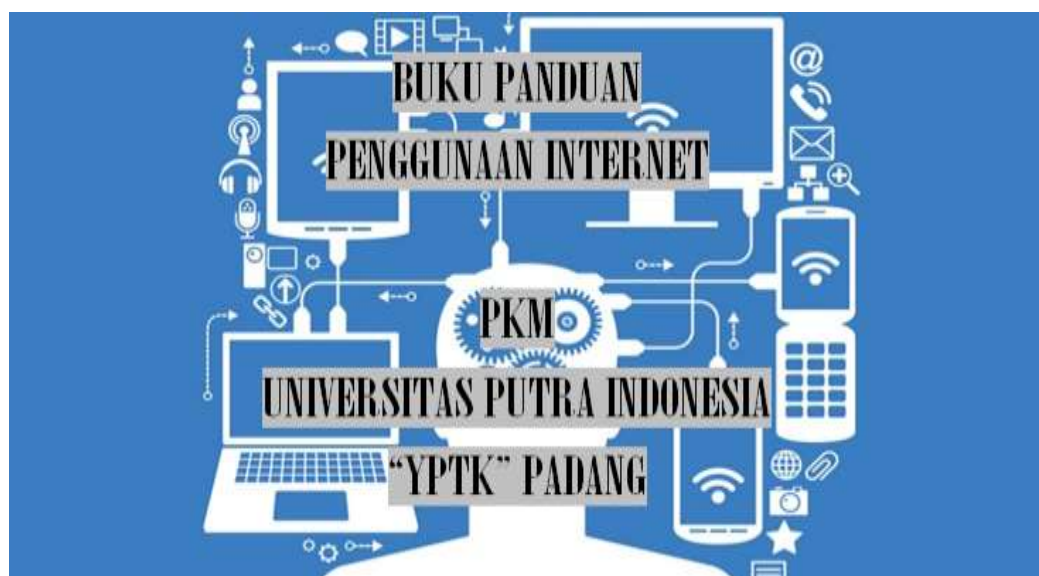
Gambar 2. Tampilan Cover Buku Panduan

Pengabdian pada masyarakat ini berhasil membuat buku panduan yang bisa digunakan oleh guru-guru dalam membuat bahan ajar. Adapun tampilan buku panduan sebagai berikut 10 :