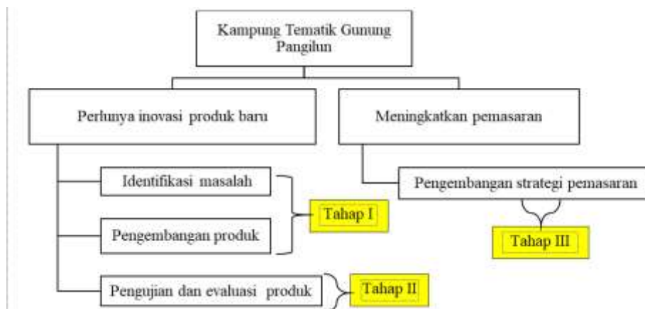
Gambar 1. Kerangka Pemikiran Pengabdian Kepada Masyarakat Kerajinan Akrilik

Kerangka pemikiran untuk kegiatan Pengabdian Kepada Masyarakat kali ini dapat dilihat pada Gambar 1 di bawah ini.