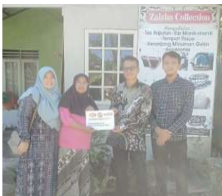
Gambar 4. Dokumentasi Sosialisasi