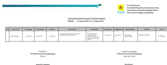
Gambar 13. Tampilan Rekap Data Keluhan Tegangan Rendah