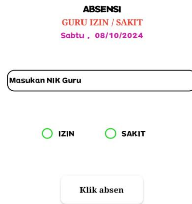
Gambar 5. Absensi Guru

Form absensi adalah form yang berisi informasi guru yang melakukan absensi kehadiran di mana guru bisa mengisi izin atau sakit. Bagi guru yang tidak hadir tanpa keterangan, maka sistem akan mengisi secara otomatis kehadiran guru dengan pengisian tidak hadir. Apabila guru berhalangan hadir atau izin, maka guru harus mengirim surat ketidakhadiran kepada admin melalui chat whatsapp dan admin akan mengkonfirmasi izin guru.