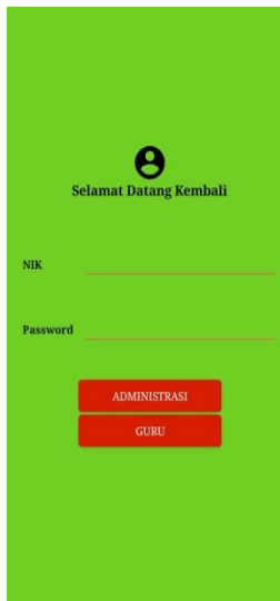
Gambar 3. Login Aplikasi

Berdasarkan pada gambar tampilan 3, form login terdiri dari tombol masuk. Tombol masuk merupakan tahap awal sebuah aplikasi dijalankan dengan memasukkan NIK dan Password