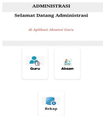
Gambar 4. Menu Utama

Form menu utama merupakan tampilan awal setelah kita masuk dengan Login, dan tampilan awal dalam memilih menu-menu yang ada didalam sistem. Adapun menu-menu tersebut terdiri dari data guru, data absensi dan data rekap absensi.