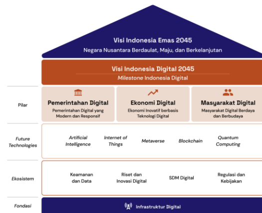
Gambar 1. Visi Indonesia Digital 2045

hal ini ditandai dengan peluncuran Visi Indonesia Digital VID 2045 sebagai konsep, visi, dan arah strategi nasional dalam mendorong terwujudnya Indonesia Digital 2045 [2]. Dengan adanya peta jalan VID 2045 ini menjadikan Proses transformasi digital di Indonesia lebih terstruktur dan memiliki dukungan penuh dari pemerintah. Dalam VID terdapat 5 Future Technologies yang menjadi yang dinilai dapat mendisrupsi supply chain pada sektor-sektor konvensional [3], Hal ini memiliki arti bahwa kelima teknologi tersebut berpotensi mengubah kerja ratai pasok yang saat ini ada menjadi lebih baik.