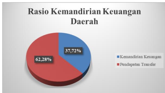
Gambar 3. Diagram Rasio Kemandirian Keuangan Daerah 2020-2024