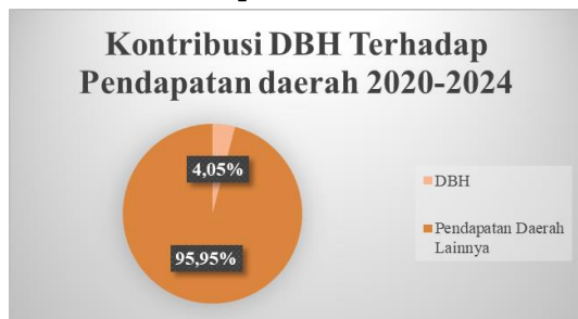
Gambar 2. Diagram Kontribusi DBH Terhadap Pendapatan daerah 2020-2024